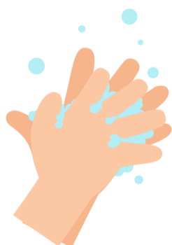
4 Finger überkreuzen