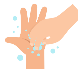
6 Fingernägel reinigen