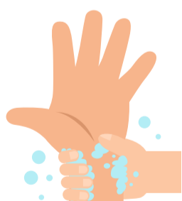
7 Handgelenk reinigen