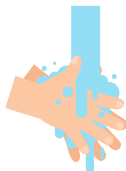
8 Hände spülen