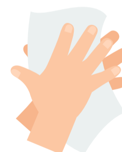
9 Hände trocknen

Weitere Informationen zum Coronavirus sind beim Kanton St. Gallen zu finden. www.sg.ch/coronavirus