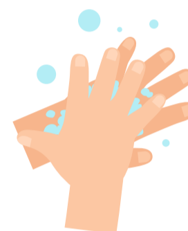
3 Handrücken einreiben