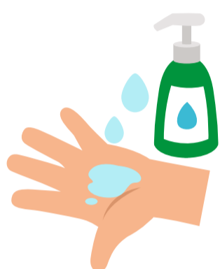
1 Seife benutzen